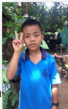
Wut. 8 años Pakodam School