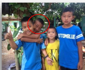
Snow. 9 años Pakodam School