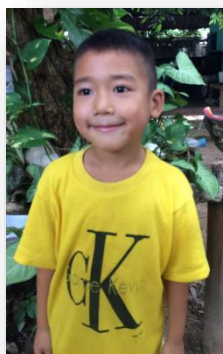
Aek. 6 años Pakodam School

Junto con esto queremos dar una linda y cálida bienvenida a siete nuevos integrantes a nuestra familia. Una nueva generación ha llegado para aprender de los mayores y llenarse de amor y esperanza para su futuro. Aquí se los presentamos.